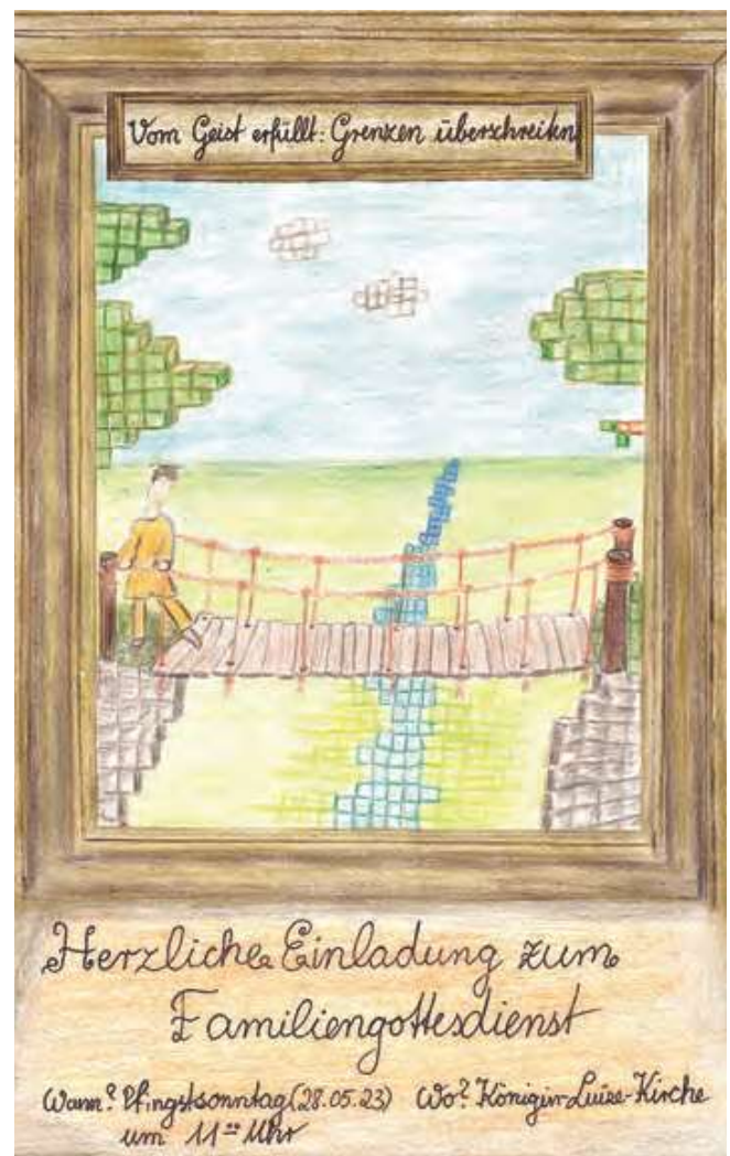
Zeichnung: Antonia Hamann